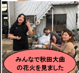
みんなで秋田大曲の花火を見ました