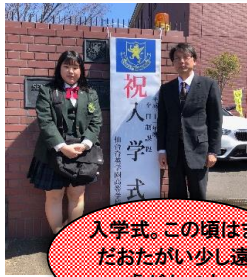
入学式。この頃はまだおたがい少し遠慮がちです

今の宮城には、ホストファミリーの数が年々増加しています。この春、秋田大曲の花火大会が開催され、多くの人々が参加しました。また、入学式も無事終了し、新しい仲間が増えました。