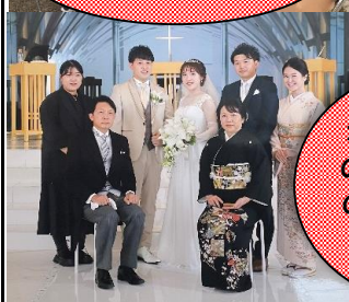
ホストスターの結婚式。感動の涙を流していました