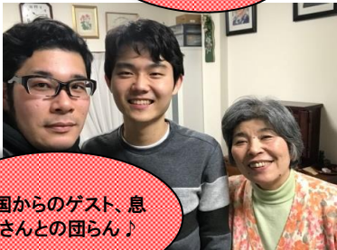
韓国からのゲスト、息子さんとの団らん♪

【ファミリー紹介】 今回ご紹介させていただいたファミリーは、お子様が一人のホストファミリーです。関西エリアでは大人気なファミリーのひとりです。 ホストファミリーは、ザ・日本の春にはお受け入れされたゲストさん、お会いしてもお話しが盛り上がります。オムライスやお餅、餃子など、懐かしいお料理もたくさんあります。 このようにお受け入れ後もゲストさんとの繋がりが大切ですが、今回は大学の短期プログラムに参加した韓国の大学生を3週間お受け入れたことができました。