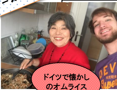
ドイツで懐かしいオムライス